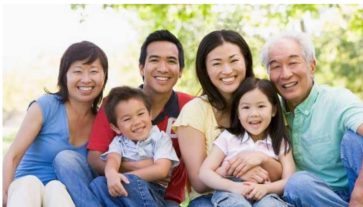
Keluarga Bahagia Membentuk Sikap Positif Anak-anak